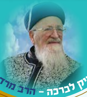
זכר צדיק לברכה - הרב מרדכי אליהו

נולד בירושלים לרבי סלמאן אליהו ולרבנית מזל, אחות הרב יהודה צדקה. אמו הייתה נכדת אחותו של ה"בן איש חי". בגיל 11 אביו נפטר, והמצב הכלכלי בבית דחק אותו לצאת לעבוד כמנור חמוס בשוק. כבר בילדותו בלט בכישרונו. כשהיה נער, קיבל מפתח לשיבת פורת יוסף שבעיר העתיקה, והוא היה מגיע בשעות הערב וישב ללמוד. בהמשך החל ללמוד בישיבה באופן רשמי, תחת הנהגתו של הרב עזרא עטיה. הוא היה פוסק, דיין, וממנהיגי הבולטים של הציבור החרדי הספרדי. שימש גם כראשון לציון בתפקיד הרב הראשי לישראל. נפטר לפני 14 שנים ונקבר בהר המנוחות, באוהל שבו קבור החיד"א, שאת עצמותיו העלה לארץ וקבר שם 50 שנה קודם לכן.