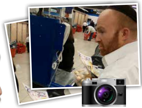
נצפה באוויר עד ירושלים

בולטנים בישראל נפוצים מאוד בסביבות ים המלח. עד לפני שש שנים עמד מספרם על יותר מ-6,000!