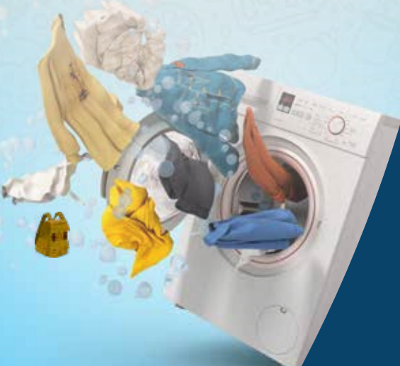
מעובד ומעוצב ע"י המערכת לזווה הקוראים ובאישור בית הרב