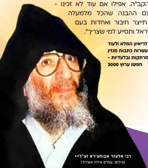
רבי אלעזר אבוחצירא זצ"ל << (נילום: עמרם אילוז אשדוד)

לריאיון המלא ולעוד עשרות כתבות מגזין מרתקות ובלעדיות - חפשו ערוץ 2000