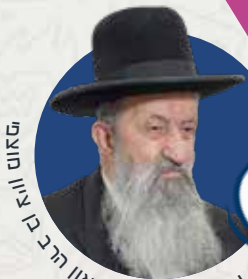
על פי תשובות הגאון הרב בציון ציון