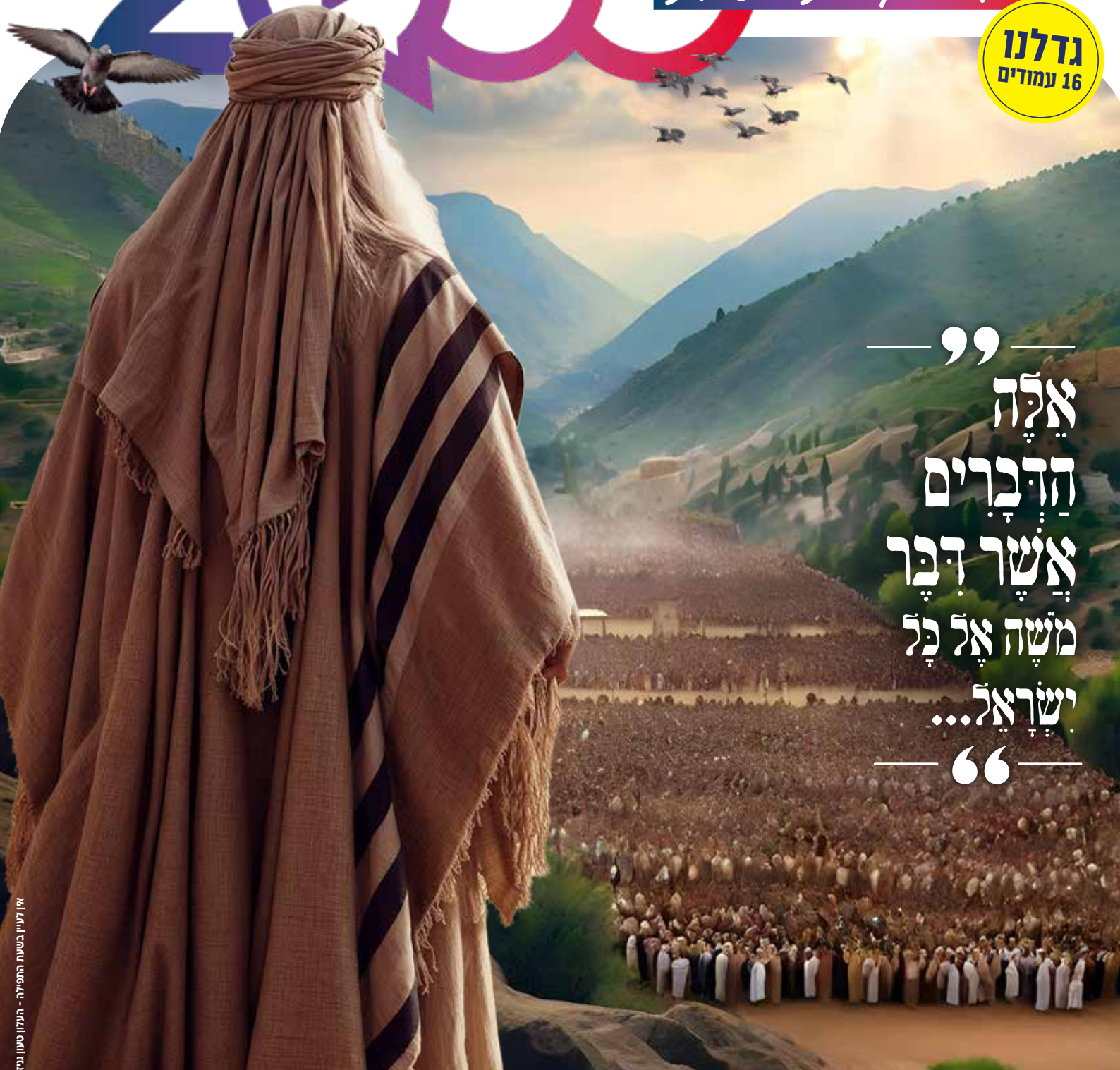
אין לעיין בשעת התפילה - תעיון טעון נעשה

— ” — אלה הדברים אשר דבר משה אל כל ישראל... “ —