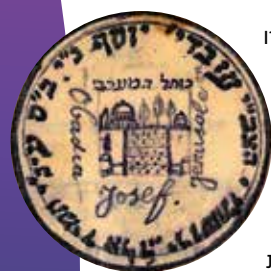
חותמת שצייר בגיל 15 באחת המחברות באדיבות מכוון מאור ישראל