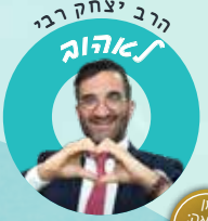
הרב יצחק רבי לאהוב