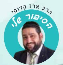
הרב ארז קדוסי