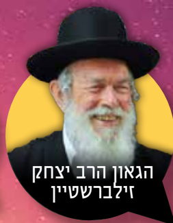
הגאון הרב יצחק זילברשטיין