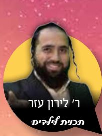
ר' לירון עזר תכנית אֵלֵיִם