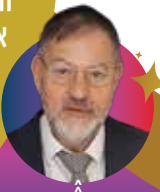
מנהל ת"ת בוסטון

עדות מצמררת שהובאה בספר "לפיד האש" מראה עד כמה יקרה הייתה ההכנה לשבת קודש בעיני גדולי ישראל. שלושה ימים בלבד אחרי סיום השואה הארורה, בערב שבת קודש, העולם כולו עדיין היה עסוק בעיכול מימדי השכול, האובדן והחורבן. עם ישראל החבול רק החל לספור את יתומיו. אבל היה אחד חריג בנוף האפרורי של אותם ימים - האדמו"ר בעל ה"שפע חיים" מצאנז-קלויזנבורג. כאילו מעולם לא עברו עליו שנים איזמות בהן שכל את ילדיו ורבים מחסידיו - מרגע שהסתיימה המלחמה, החל בהכנות לקראת שבת המלכה.