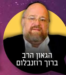
הגאון הרב ברוך רוזנבלום