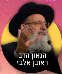
הגאון הרב ראובן אלבז