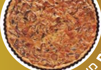
החטבת חירב חלכה