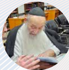
הגאון הגדול הרב משה מאיה שליט"א זקן מועצת חכמי התורה

ניתן להשיג ברשת קולמוס ובחנויות הספרים הנבחרות