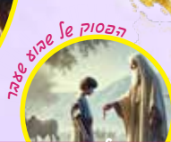
הַפְּסוּק le biaz se שֶׁבֵּר

תָּנוּ פְּסוּק: יֵשׁ לָכֶם רֵאיוֹן מִה הַצִּיּוֹר מֵהַכֶּסֶף? מַה לוֹ לְאִתִּין!