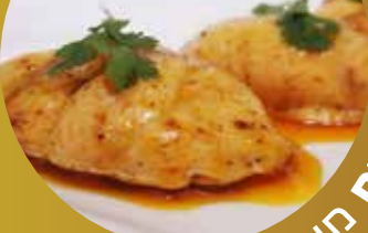
ההטבה מירב חלכה