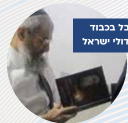
הגאון הגדול הרב מסעוד בן שמעון שליט"א רבה של בני ברק