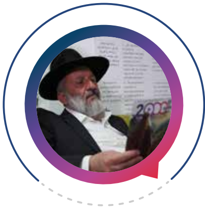
הרב אריה דרעי (65) ירושלים - יו"ר תנועת ש"ס

שלוחא דרבנן, המבוגר האחראי הבלתי מעורער שהוביל להקמת ממשלת האחדות כנגד כל הסיכויים. בכל ההחלטות הגורליות הוכיח את כושר מנהיגותו, מעשיו קידשו שם שמים ברבים וזכו לשבחים מכל כיוון.