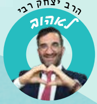
הרב יצחק רבי לאהבה