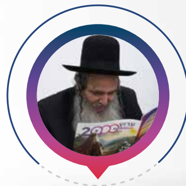
הרב שלום ארוש שליט"א

אני רוצה לברך את ערוץ 2000 שפועלים ימים כלילות בזיכוי הרבים על מנת לחזק את התורה וההלכה על פי המסורת שלנו. ברכה והצלחה בכל אשר יפנו.