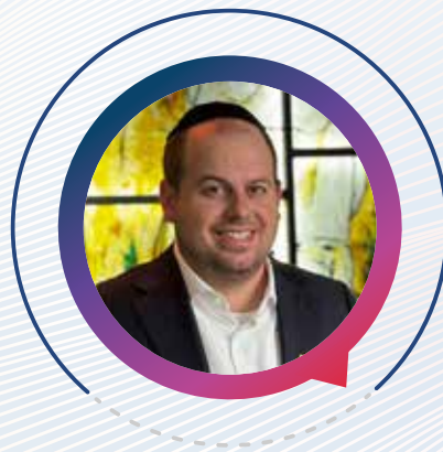
שי גראוור (35) ירושלים - שר החסד

רב הכותל והמקומות הקדושים, שמאז פרוץ המלחמה פועל רבות לקיום עצרות תפילה המוניות ומרכזיות ברחבת הכותל כדי לאחד את העם במקום המאחד ולחזק את משפחות הנרצחים והחטופים.