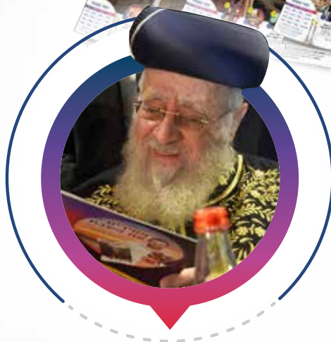
מרן הראש"ל הרב יצחק יוסף שליט"א

אני שמח לברך בלב שלם את ערוץ 2000 היקר שעושים עבודת קודש בזיכוי הרבים, אשריכם עלו והצליחו.