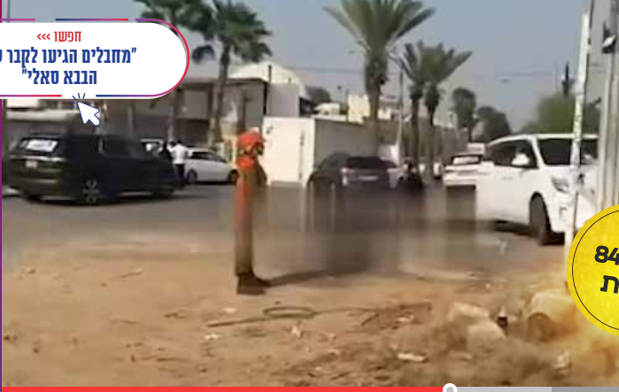
00:55 / 00:45