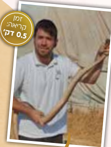
זמן קריאה דק 0.5

תלום-קשקים מצוי הוא מהגדולים שבנחשי ישראל. מדובר בנחש תת-ארסי, כלומר יש לו ארס, אך שיני הארס שלו אחוריות ומרזביות. בניגוד לנחשים בעלי גיבי ארס רגילים, שיני הארס של התלום דומות יותר לשיניים עם חריצים, המאפשרים לארס לטפטף עליהם. למרות היותו ארסי, התלום לא נחשב לנחש מסוכן, ונדיר מאוד שהוא משתמש בארסו נגד בני אדם. השם "תלום" נגזר מהתלם או הקמט שיש במרכז כל קשקש שלו. התלום נפוץ בחלקים נרחבים של הארץ, מצפון לדרום.