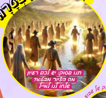
תנו פסוק: יש לכם רעיון מה הציור מהכאן לחו לנו לחייל