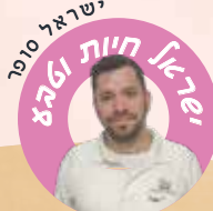
ישראל 2010 ד"ר סת'ר חיות ורבי

זו ההזדמנות לברר עם עצמי מה כל כך חשוב לי בכל אחד מהרצונות הללו. למה חשוב לי לכבד הורים? מה זה ייתן לי בחיים? האם כששמעתי בקולם בעבר הייתה לי ברכה, כמו שכתוב בתורה? האם כשאשמע בקולם, אפסיד או שארוויח להיות מחושבת יותר ומאופקת יותר? אחרי שאברר, אוכל להחליט מה שווה לי לשלם: האם שווה לוותר על כיבוד הורים בשביל קניות, או לוותר על חלק מהקניות ולשמר את הכבוד להורים? בהצלחה רבה!