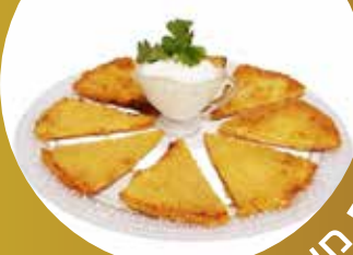
ההטבח מירב חלכה