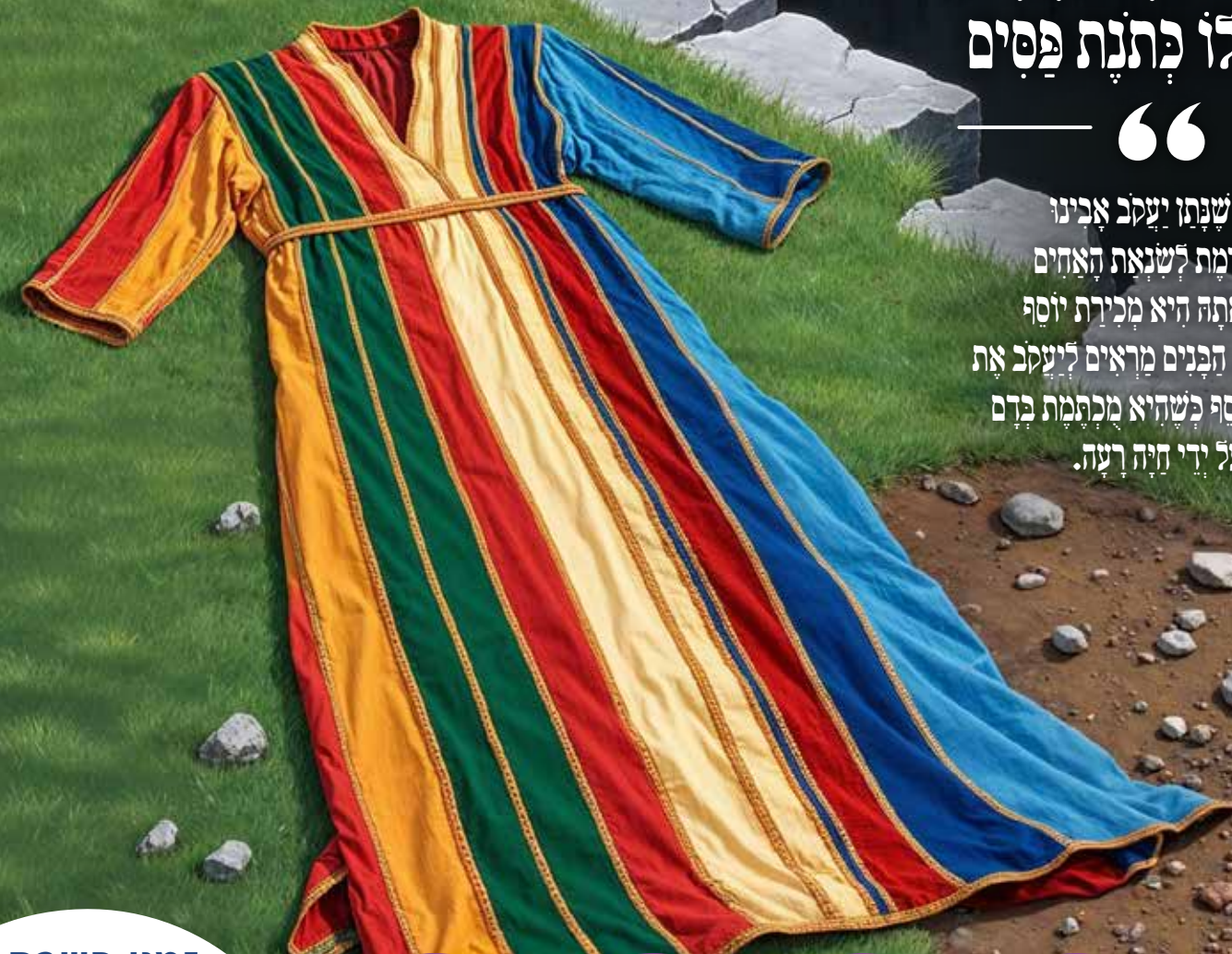
אין לנתן בשעת התפילה - המגזין טעון נגינה

כְּתַנַּת הַפְּסִים שֶׁנָּתַן יַעֲקֹב אֲבִינוּ לְבָנָיו יוֹסֵף גִּזְרָמַת לְשִׁנְאוֹת הָאֲחִים אֵלָיו, שְׁתוּצָאָתָהּ הִיא מִכִּירַת יוֹסֵף לְיִשְׁמַעֲאֵלִים, הַבְּנִים מְרֵאִים לְיַעֲקֹב אֶת כְּתַנָּתוֹ שֶׁל יוֹסֵף כְּשֶׁהִיא מְכַתֶּמֶת בְּדָם כְּמוֹ שֶׁנֶּטְרַף עַל יְדֵי חֵיהָ רַעָה.