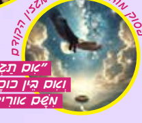
אם תגיה כנר ואם גין כובים שים קנר משם אורידך ואם ה"