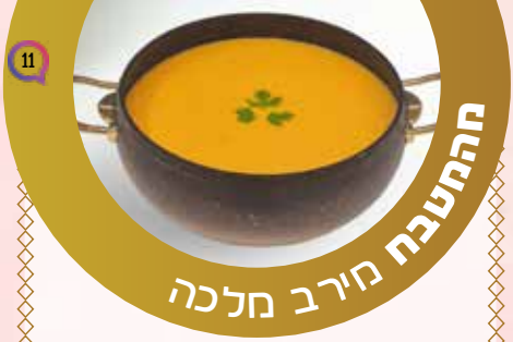
ההמטבח חירב חלכה