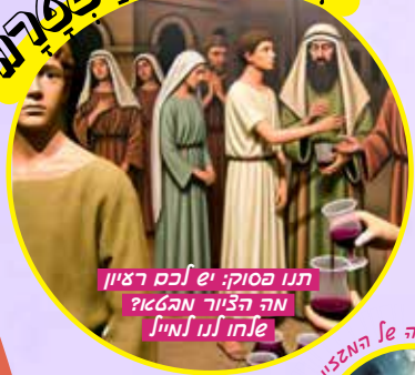
תנו כסוק: יש לכם רעיון מה הציר מהאזן אלחו לנו לחייל