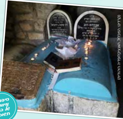
קדוסי, המעצב והמנחה, המצטיין והחידושי