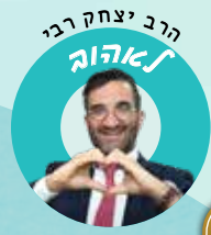
הרב יצחק רב לאהוב