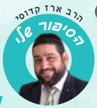
הרב ארז קדוסי הסיפור של