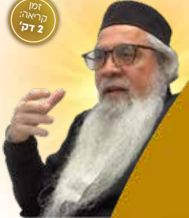
דמו קריאה: ד"ר 2

"ענין הנחת תפילין בתפילת מנחה רלוונטי גם לשאר ימות השנה, ולא רק בתעניות. זה על פי מנהגו של רבנו האר"י הקדוש, להניח תפילין של רבנו תם בכל תפילת מנחה. ואחרי שגילה את מעלת תפילין של שימושא רבה, כתב שיש להניח תפילין של רש"י ורבנו תם ביחד בשחרית, ובמנחה תפילין דשימושא רבה. ההסבר הוא שלפי הקבלה, בשעת המנחה יש דין בעולם. ולכן, חלק ממיתוק הדין הוא להניח תפילין. וכל שכן בימי תענית, ולכן נהגו גם המון העם בדבר".