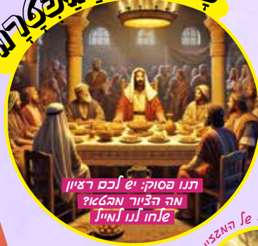
תנו כסוק: יש לכם רציון מה הציור מהאקו? עלחו לנו לחיות!