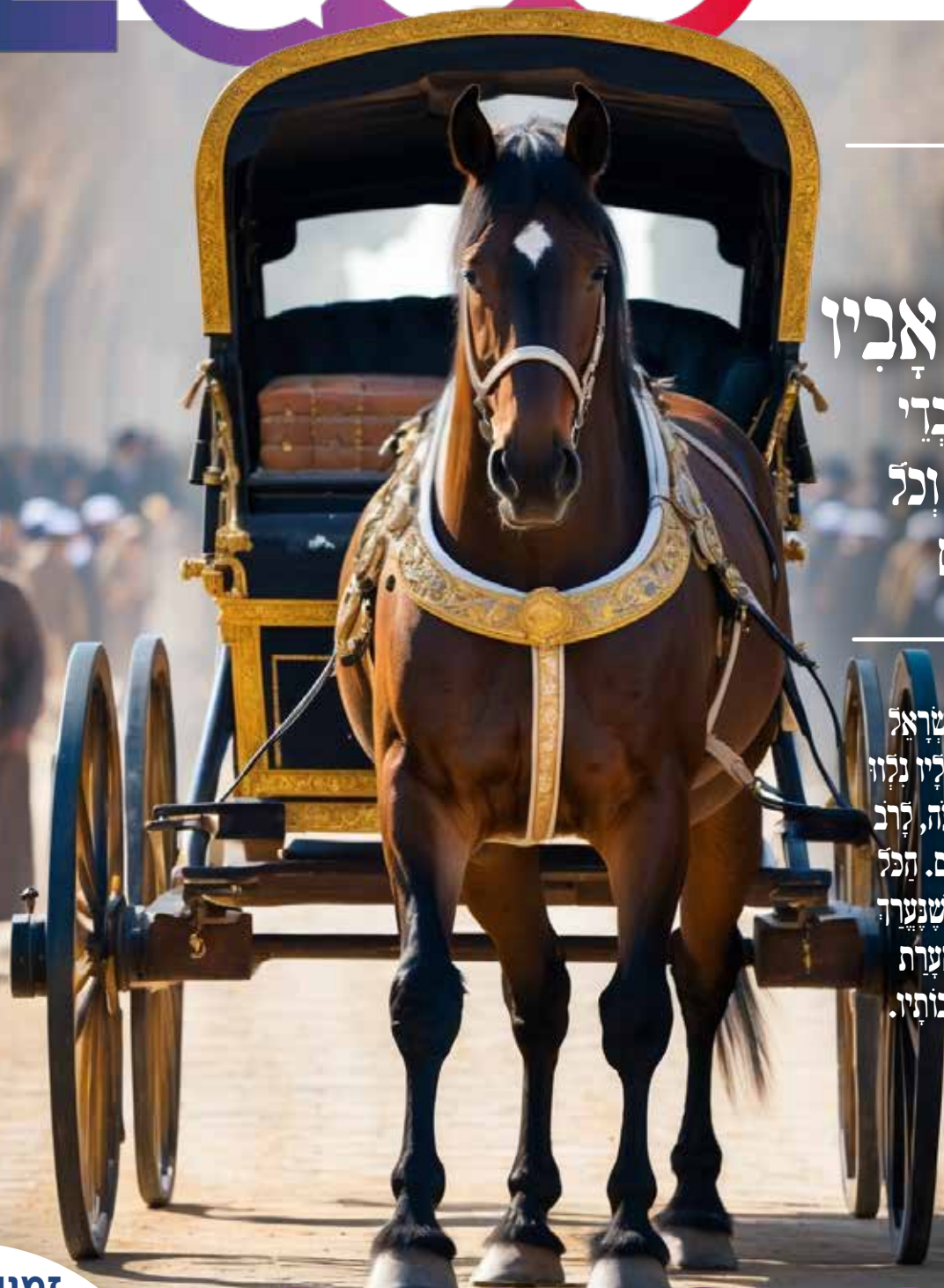
אז לעינו בשעת התפילה - המגזין נעמן נציה

“ יוסף הצדיק עלה לארץ ישראל לקבר את אביו יעקב, ואילו נלוו נכבדי מצרים ועבדי פרעה, לרב כבודו וחשיבותו בעיניהם. הכל בכך את פטירתו במספר שנערך שבעה ימים, ולידהו עד מערת המכפלה שם נטמן עם אבותיו.