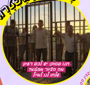
תנו ססוק: יש לכם רעיון מה הציור מהאזן ולחו לנו לחייל