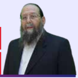
זמן קריאה: דק' 1