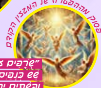
ססוק מהפכר se המאזן הקודם