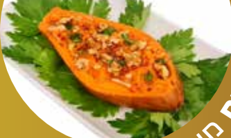
ההטבה מירב חלכה