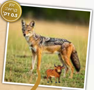
זמן קריאה: דק 0.5

יצא לכם פעם לערוך הליכת ערב בקצה השכונה, כשלתעת נשמעו יללות חזקות מכיוון החשיכה? סביר להניח שהיללן המסתורי הוא לא אחר מאשר התן הזהוב. התן, שמשתייך למשפחת הכלביים, הוא טורף שגודלו כשל כלב בינוני. הוא נוהג לטוטט בלהקות ולצוד בעלי חיים קטנים. התנים מתקשרים עם סביבתם באמצעות יללות עזות וחזקות. בשנים האחרונות הם הופכים נפוצים יותר ויותר באזורים מיושבים, לעיתים אף בשעות היום. הסיבה לכך היא המזון שאנשים משאירים לחתולי הרחוב ליד פחי האשפה וכדומה. הרגלי האכילה החדשים של התנים פוגעים בשעון הביולוגי ובכישורי הצייד הטבעיים שלהם, ומושכים אותם לאזורים מיושבים. מצב זה מזיק הן לאנשים והן לחקלאות. כיום ניתן למצוא תנים כמעט בכל רחבי הארץ, מהגליל ועד הנגב. הם מהווים חלק בלתי נפרד מהנוף הישראלי, אך חשוב לשמור על ריחוק ולא להאכיל אותם, כדי לשמר את הפרדה בין שטחי מחייה טבעיים לאזורי יישוב אנושיים.