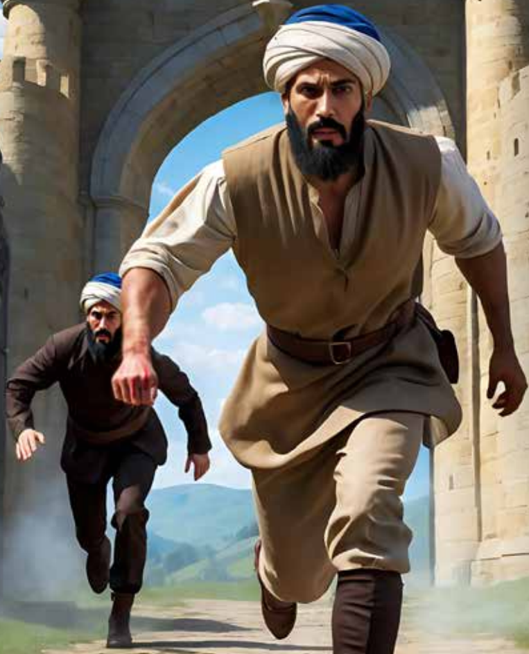
איז לענין בשעת התפילה - המגזין טעון נטייה

עַרְי הַמִּמְלָכָה נִוְעָדוּ לְהַגֵּן עַל מִי שֶׁהָרַג בְּשׁוֹגְגָה, וְלֹא־אִפְשָׁר לָו לְהַמְלֵךְ אֲלֵיהֶן. הַנִּמְלָכָה שׁוֹהָה בְּגִלּוֹת בְּעִיר הַמִּמְלָכָה, מִוִּגְזַן מִפְּנֵי גִּזְאֵל הַדָּם שֶׁאֵינִי יָכוֹל לִפְנֹעַ בּוֹ שֵׁם. דִּין זֶה מְשַׁלֵּב בֵּין צַדִּיק לְרַחֲמִים – מִכְּדוּן בֵּין רִצְחָן מְכוּזָּן לְבֵין מַעֲשֵׂה שְׂפָעָה שֶׁבְטָעוֹת אִוֵּ בַחֲסֵר כּוֹנֵנָה.