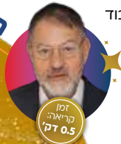
זמן קריאה: דק' 0.5

כך גם ביקשה התורה: עד לפני כמה ימים בני ישראל היו עבדים במצרים. הם עדיין מרגישים את הקושי, הצער והרצון לכבוד