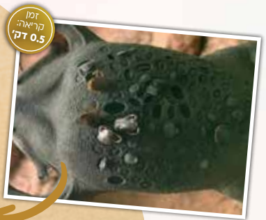
זמן קריאה: דק 0.5

גם כאשר הצפרדעים הצעירות בוקעות, הן ממשיכות להשתמש בגב של אימא כמקום מחסה בטוח. רק כשהן בוגרות מספיק, הן עוזבות סופית את גבה של האם המסורה, שעד אז מגנה עליהן בגופה ממש.