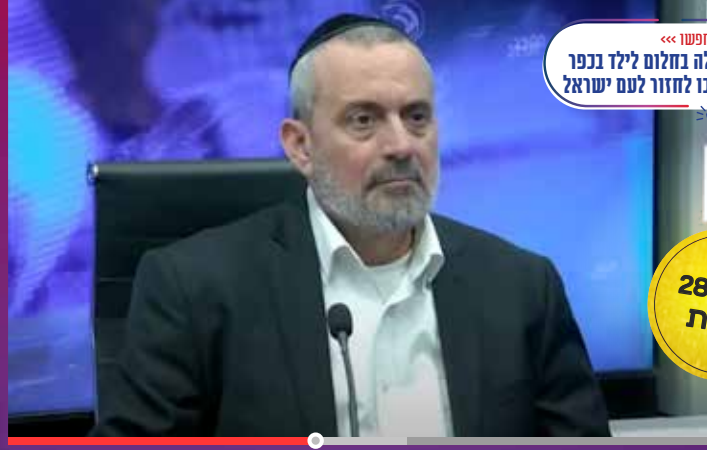
חפשו >>> הבבא סאלי נגלה בחלום לילד בכפר הערבי והפציר בו לחזור לעם ישראל