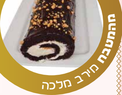
החטבת חירב חלכה