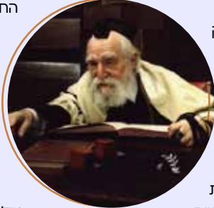
רבי משה פיינשטיין זצ"ל

היה זה בעיר ליוון שברוסיה הסובייטית, בתקופה האפלה שבה כל זק של יהדות היה בבחינת סכנת נפשות. בתנאים בלתי אפשריים, כשדירתו נקחה ממנו על ידי השלטונות והוא נאלץ להצטופף עם שלושת ילדיו בחדרון קטן בביתו של שקמט בית הכנסת, המשיך רבי משה פיינשטיין להנהיג את קהילתו במסירות נפש. הרב פיינשטיין ניצח על מערך שלם של חיי יהדות