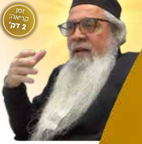
זמן קריאה: 2 דק'

האם בימינו אפשר להיטהר בטהרת פרה אדומה, ומה משמעותה כיום?