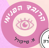
חלק ב' ואחרון שיקול