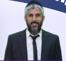
זמן קריאה: דק 1.5

כשעמד ליד משרד המנהל, פתאום הדהדה במוחו ההבטחה שנתן ל"חפץ חיים". "לא אפר את ההבטחה שלי", אמר לעצמו והחליט - "אני חוזר הביתה".