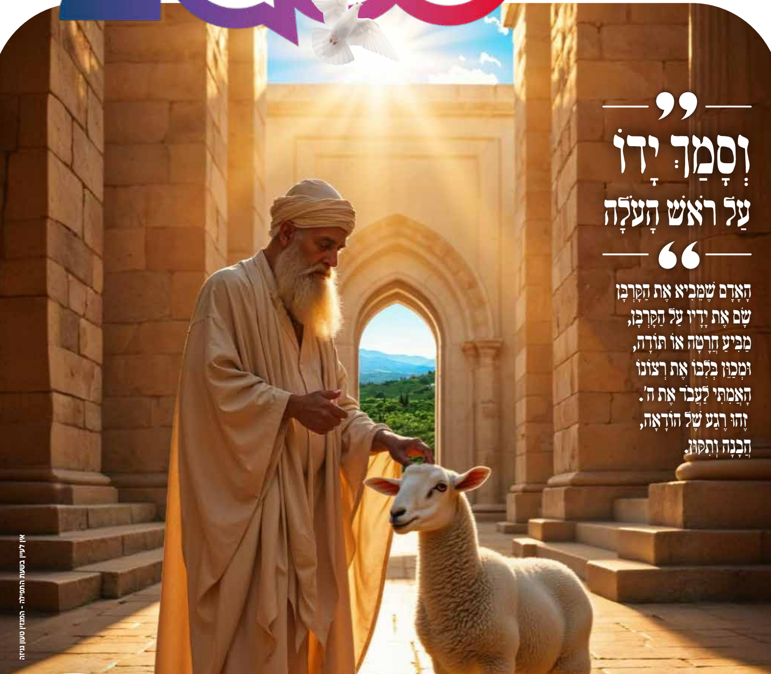
אין לעיתון כמעט התפילה - המגזין טעון בנייה

הָאָדָם שֶׁמֵבִיא אֶת הַקָּרְבָן, שֵׁם אֶת יָדָיו עַל הַקָּרְבָן, מֵבִיעַ חֲרָטָה אוֹ תוֹדָה, וּמְכוּז בְּלִבּוֹ אֶת רְצוֹנוֹ הָאֱמֵתִי לְעִבְדֵי אֱתֵי ה'. זֶהוּ רִגַע שֶׁל הוֹדָאָה, הַכְּנָה וְתַקוּן.