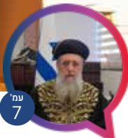
7 עמ' ריאיון מיוחד ובלעדי עם מרן הראשון לציון יהונתן דדון