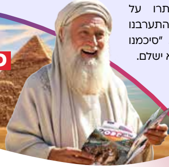
"אין זכות במזכה" הרבנים

משלמים רק עבור המשלוח, ומקבלים את המגזינים להפצה - בחינם!