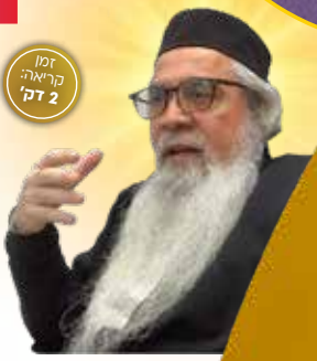
זמן קריאה: 2 דק'

כיניו מיוחד לליל הסדר. ישנן שלוש סיבות מאחורי השם: הראשונה, שהקב"ה שמר וציפה ללילה הזה כדי לקיים הבטחתו להוציא את ישראל ממצרים. השנייה - חמנינו ז"ל דרשו שהכפילות "שימורים" בפסוק מלמדת שבליילה זה נעשו ניסים לצדיקים לאורך הדורות: הצלת חזקיהו מסנחריב, הצלת חנניה וחבריו, והצלת דניאל מגוב האריות. ולעיתים לבוא, בליילה זה יתגלו המשיח ואליהו הנביא. והסיבה השלישית היא שהלילה הזה מושמור מן המזיקים.