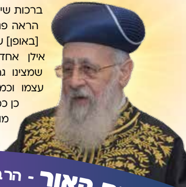
זמן קריאה: דק 1.5

עיינ ב"ילקוט יוסף" בבירור דעת מרת מלכא [הרב עובדיה יוסף] זצ"ל בזה: מסיום דבריו נראה דאף שב"חזון עובדיה" על פסח החמיר שלא לברך על אילן אחד, משום דשב ואל תעשה עדיף [במצבי ספק, עדיף להימנע מפעולה מאשר לטעות], מכל מקום, ב"חזון עובדיה" על ברכות שיצא מאוחר יותר הראה פנים להקל, היכא [באופן] שאינו מוצא אלא אילן אחד, ובפרט אחר שמצינו גרסה כזו בש"ס עצמו וכמו שהעתיקו גם כן כמה ראשונים, וכן מובא בשם הגאון