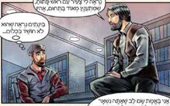
בסיומו של אחד השעורים בחנות.