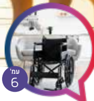
6 עמ' הילדה בכיסא גלגלים - בגלל השם? הרב שמשון פוקס