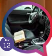
12 עמ' הקמע שלא באמת היה קמע הרב ארז קדוסי